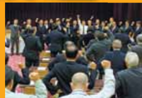
第四選挙区の会で激励を頂く