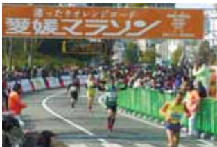
第53回愛媛マラソン（2時間49分のベストタイム）