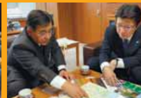
市・町長より要望・陳情を伺う