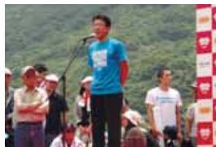
愛南町いやしの郷トライアスロン大会