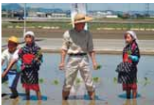
お田植え祭（農林水産研究センター）