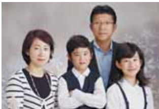
家族と（2012年愛媛県在職時）