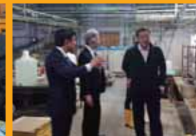
真珠の稚貝生産現場を視察