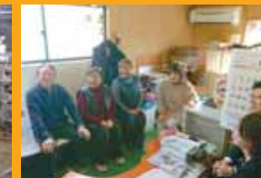
地元の方々が集まる憩いの場にて談笑